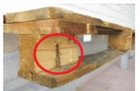
Skilusios kaladėlės, kai yra matomos vinys.