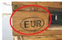
Neteisingas žymėjimas ant kaladėlių.